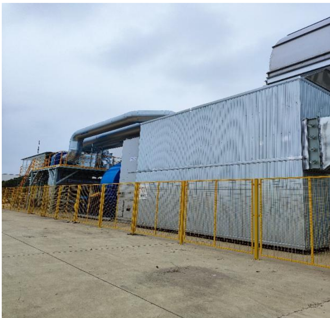
公司 VOC 处理设备

公司颁布了《质量、环境、能源和职业健康安全一体化管理手册》，该文件是协调统一公司质量管理、环境管理、能源管理、职业健康安全管理及其活动的准则，公司全体员工必须按照本手册的规定要求严格贯彻执行。公司对周边环境、职工的健康安全等方面的保护，更多地体现了企业的社会责任。自建立该体系以来，公司未发生任何生产事故、设备事故、未接到任何环境投诉等。